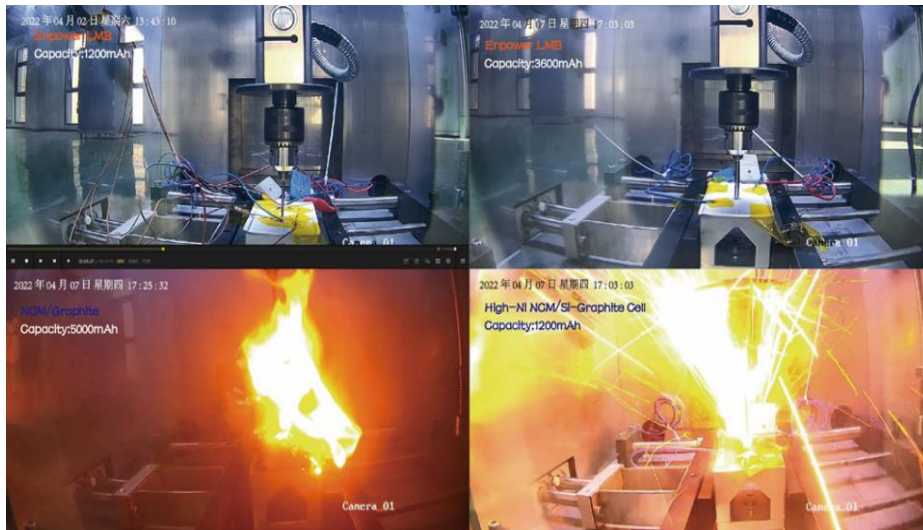
恩力针刺试验过程截图（上面两张图为恩力动力锂金属电池，下面两张为市售三元锂离子电池）